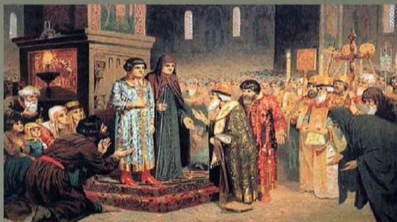
Картина А. Кившенко «Избрание Михаила Федоровича Романова на царство». Царь был избран всенародным голосованием на Земском соборе в 1613 году. В работе Собора принимали участие не только бояре, дворяне и духовенство — высшие сословия, но и посадские люди, казаки и крестьяне.