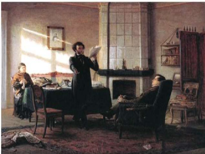
Николай Ге «Пушкин в селе Михайловском» 1875

Пушкин, стоя у письменного стола в рабочей комнате, читает свое новое произведение «Цыгане» долгожданному гостю. Рядом няня - Арина Родионовна - за обычным домашним занятием. Эта картина изображает последнюю встречу двух близких друзей. Ровно за десять месяцев до восстания Пущин первым из всех друзей и знакомых навестил опального поэта в Михайловском что было далеко не безопасно.